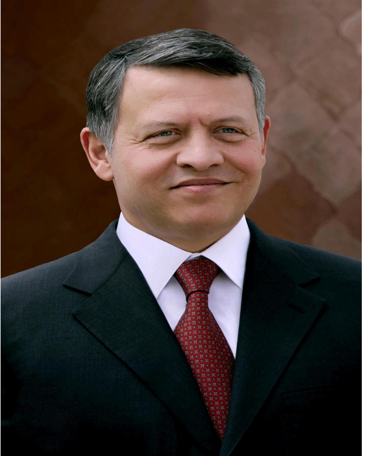
صاحب الجلالة الهاشمية الملك عبدالله الثاني بن الحسين المعظم