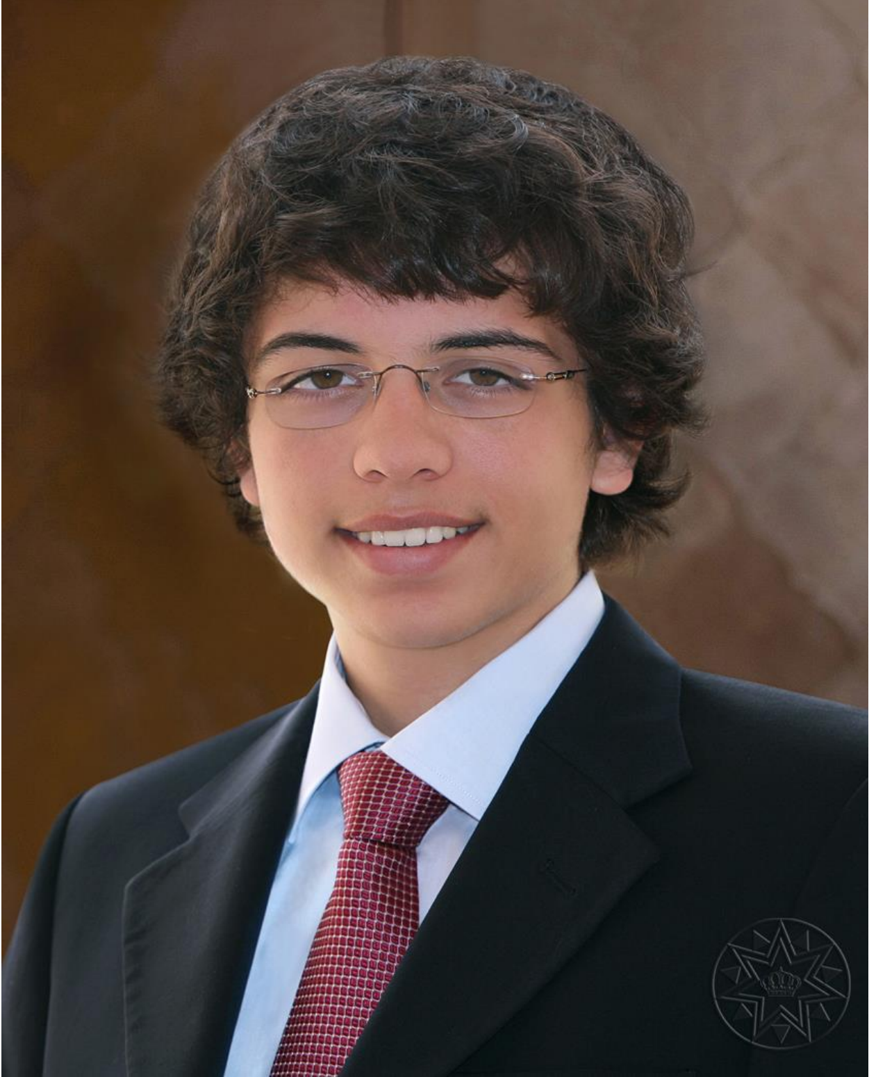
صاحب السمو الملكي الأمير الحسين بن عبدالله الثاني المعظم ولي العهد